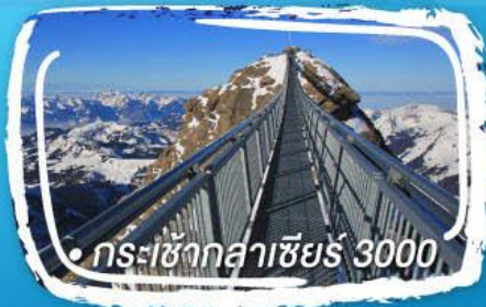
• กระเช้ากลาเซียร์ 3000