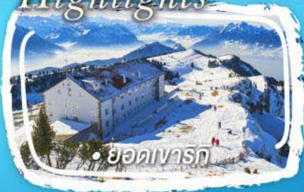
• ยอดเขารัก