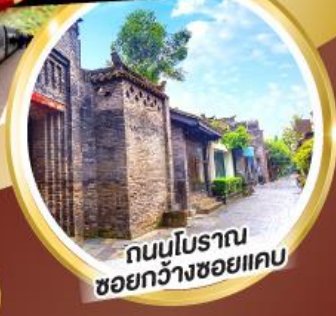
ถนนโบราณ ชอยกว้างชอยแคบ