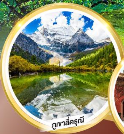
ภูเขาสี่ครุณี