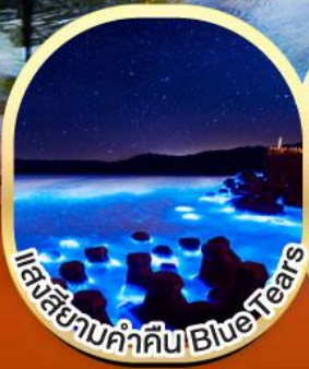
เมืองสียามคำคิน Blue Tears