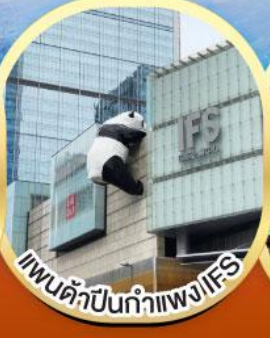
แพนด้าปีนกำแพง IFS