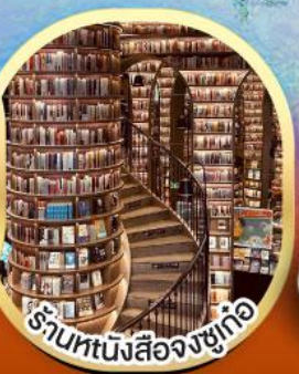
ร้านหนังสือจวงซูเก้อ