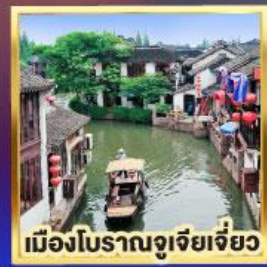
เมืองโบราณจูเจียเจียว