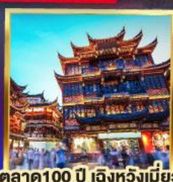
ตลาด 100 ปี เติ้งหวงเมี่ยว