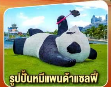
รูปปั้นหมีแพนด้าแชลฟ์