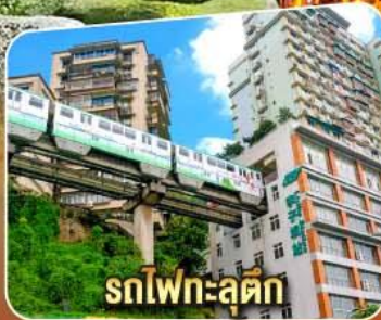
รถไฟเหาะลัดคด

เที่ยวเต็มอิ่มไม่เข้าร้านช้อปปิ้ง! เมนูพิเศษ! เปิดปิกนิก, อาหารรสฉวน