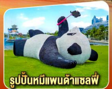
รูปปั้นหมีแพนด้าแชลฟ์