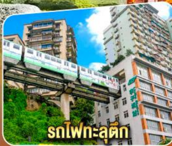
รถไฟทะลุค

เที่ยวเต็มอิ่มไม่เข้าร้านช้อปปิ้ง! เมนูพิเศษ! เปิดปิกนิก, อาหารรสฉ่ำ