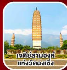
เจดีย์สามองค์ แห่งวัดหลงเซิง