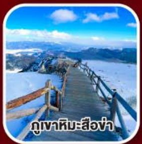
ภูเขาหิมะสี่อซ่า