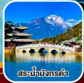
สะพานมังกรดำ