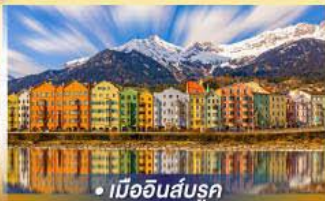
• เมืองอินส์บรุค