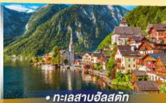
• ทะเลสาบอัลสติก