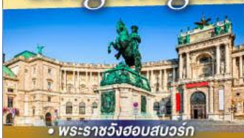
• พระราชวังฮออบสบวร์ก