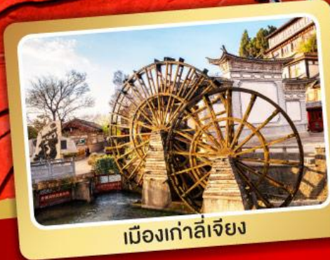
เมืองเก่าลี่เจียง