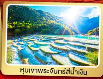
หุบเขาพระจันทร์สีน้ำเงิน