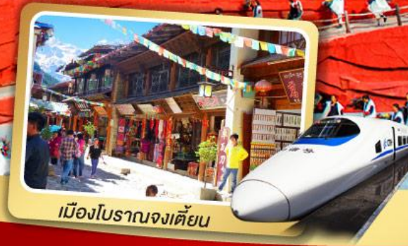
เมืองโบราณจงเตี้ยน