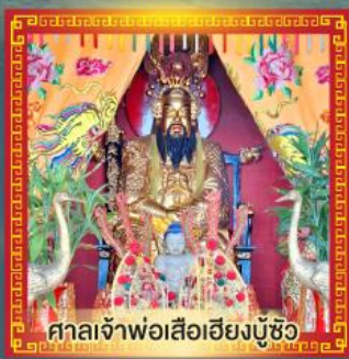
กาลเจ้าพ่อเสือฮี้ยงบูซิว