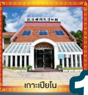
เกาะเปียวโน