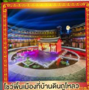
โชว์พื้นเมืองที่บ้านดินถูไหลอ