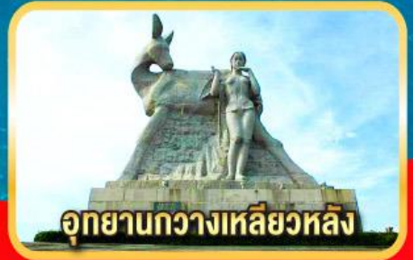
อุทยานกว้างเหลียวหลิง

เมนูพิเศษ! ลิ้มรส ไก่ไทหล่า, เซ็ตซีฟู้ดกุ้งมังกร, ขันโตกข้าวเหนียวห้าสี, อาหารเจ ณ สวนพุทธธรรมหนานชาน