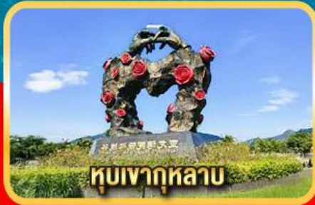
หุบเขากุหลาบ