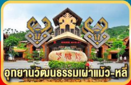
อุทยานวัฒนธรรมเฟ้าแม้ง-หลี่