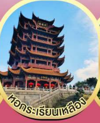
หอกระเรียนเหลียง