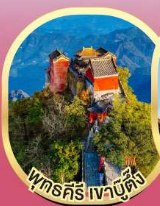
พุทธคีรี เจาบูตั้ง