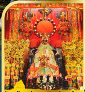
วัดเจ้าแม่กวนอิมฮ่องกง