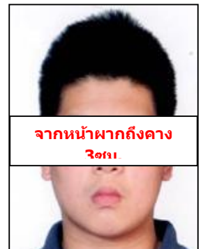
จากหน้าผากถึงคาง 3cm