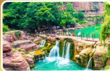
อุทยานหยุ่นโกซ่าน