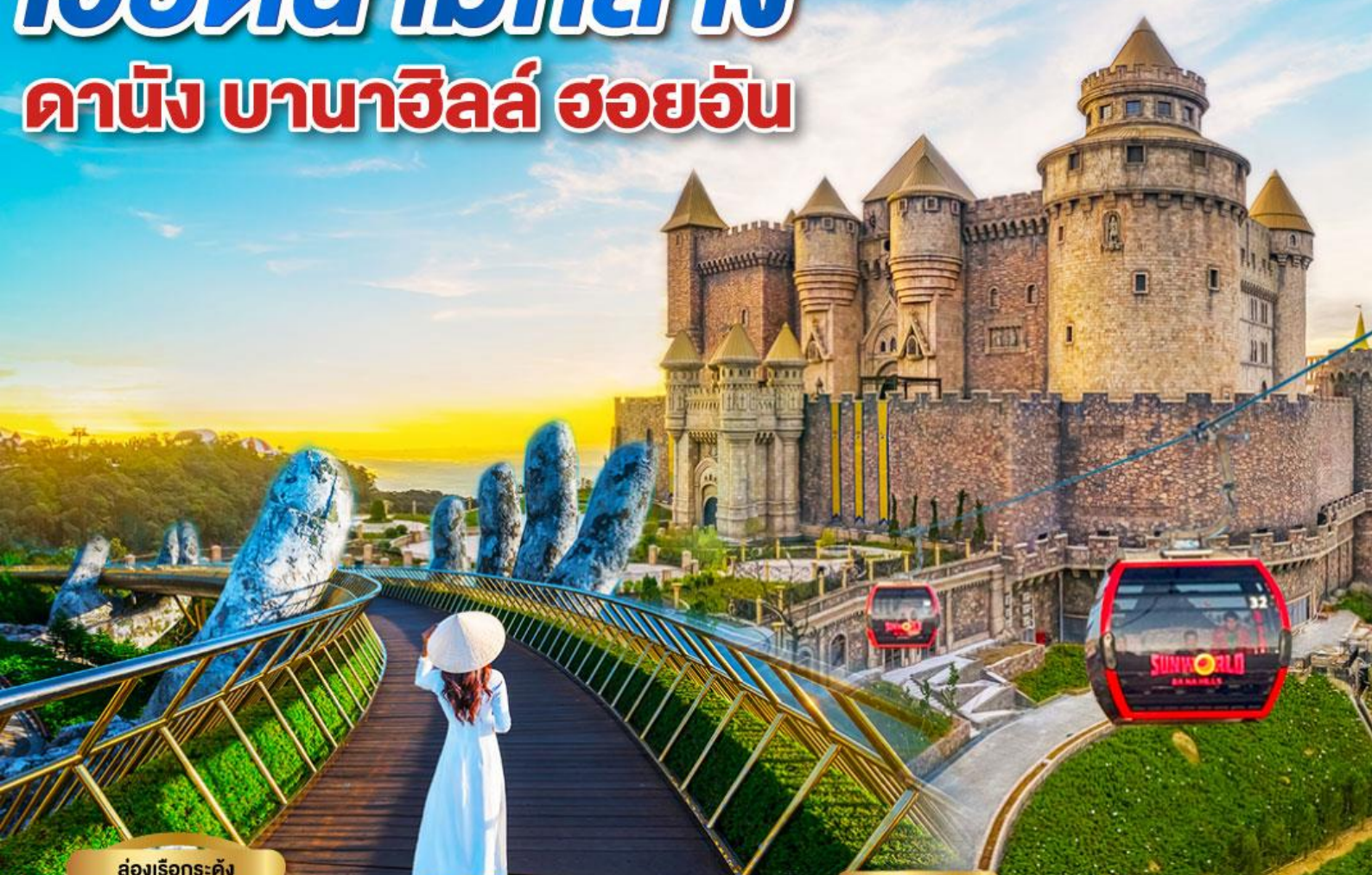
ล่องเรือกระด้ง