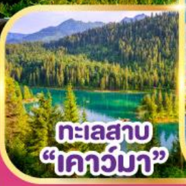
ทะเลสาบ "โคว์มา"