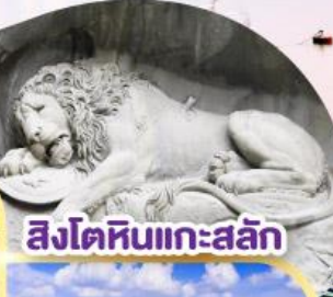
สิงโตหินแกะสลัก