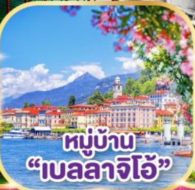
หมู่บ้าน "เบลลาจีโอ"