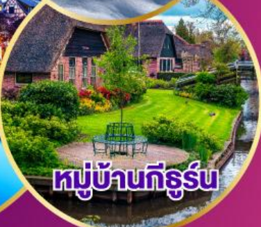
หมู่บ้านกังหัน