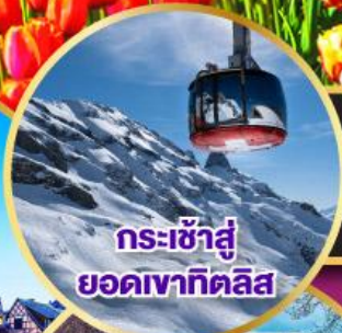
กระเช้าสู่ยอดเขาทิคลิส