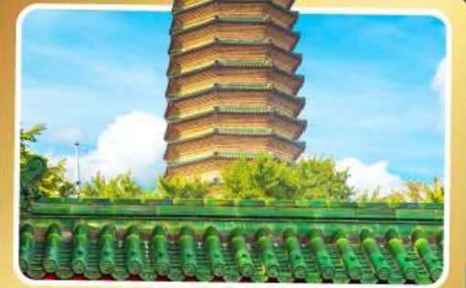
วัดพระเจี๋ยว่เก้ว

เมนูพิเศษ เปิดปักกิ่ง, ชาบูหม้อไฟ อาหารกวางตุ้ง, อาหารเสฉวน