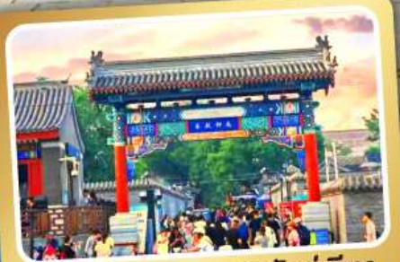
ถนนโบราณหนานหลวู่กุ่เซียง