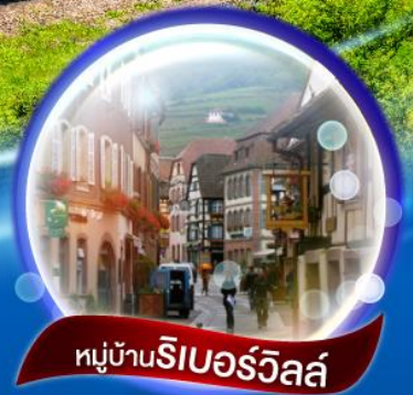
หมู่บ้านริเบอร์วิลล์