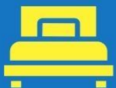
ห้องพักเดี่ยว SINGLE

ตัวอย่างประเภทห้องพัก *เป็นเพียงตัวอย่างเพื่อให้เห็นภาพสำหรับประเภทห้องในแบบต่างๆ