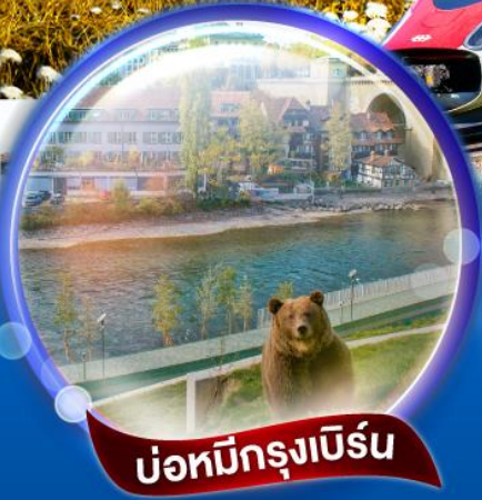
บ่อหมักกรุงเบิร์น