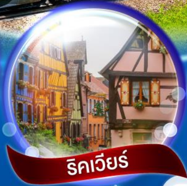
ริคเวียร์