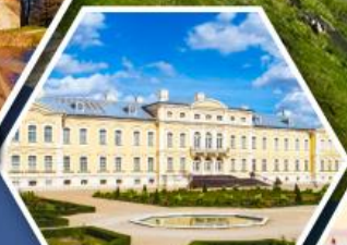
พระราชวังรินดาเล