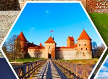
ปราสาททราไก