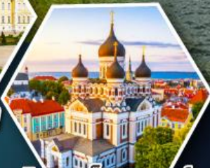
วิหารอเล็กซานเดอร์ แพลสกี (ทาลลินน์)

• ล่องเรือซิลเซียไลน์ข้าม จากเอสโทเนียสู่ฟินแลนด์ • เข้าชมโบสถ์หิน Rock Church