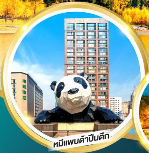
หนีแพนด้าปิ่นตัก