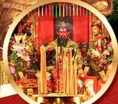
วัดกวนไท่

นมัสการองค์เจ้าแม่กวนอิม อายุกว่า 600 ปี