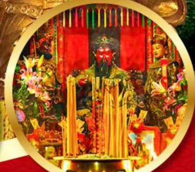
วัดกวนไท่

นมัสการองค์เจ้าแม่กวนอิม อายุกว่า 600 ปี