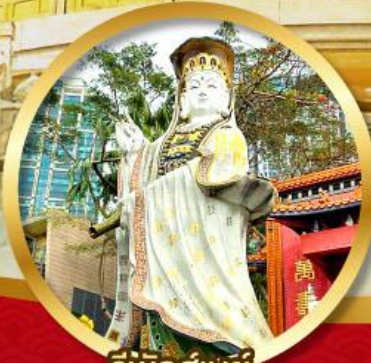
รีพัลส์เบย์