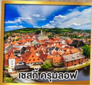
เชสกีครุมลอฟ