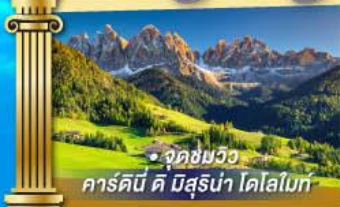
• จุดชมวิว คาร์คินี ดี บิสุรีน่า โดโลไมท์