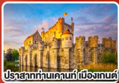
ปราสาทท่านเคานท์เมืองเกนส์