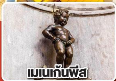
เมเนกันพีลา