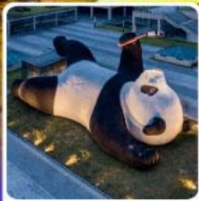
แพนด้าชลฟ์