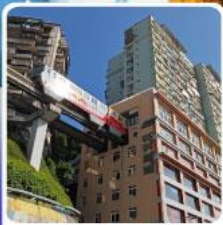
รถไฟฟ้าฉูตึก