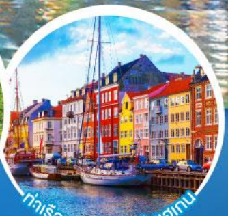
ท่าเรือบูอวาน์.โคเปนเฮเกน