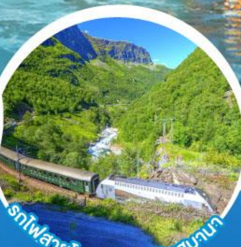
รถไฟสายโรแมนติกฟลัมสบานา