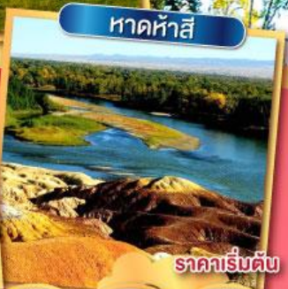
หาดห้าสี