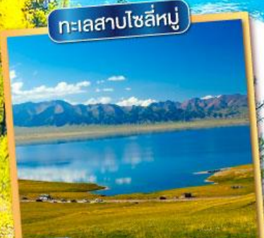
ทะเลสาบโซลีทู่