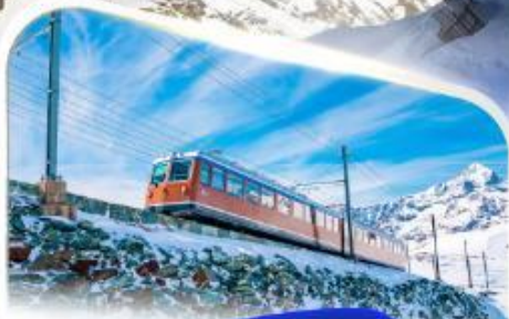
ขึ้นรถไฟฟันเฟืองที่ฟองกอนนอร์เกรต