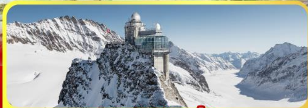
ยอดเทวจุงเฟรา