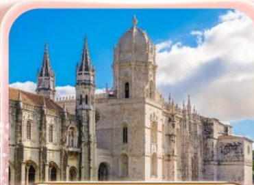
มหาวิหารจอร์นิโอ