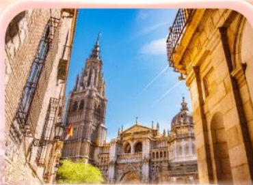
มหาวิหารแห่งโทเลโด