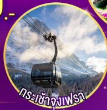
กระเช้าจุงเฟรา