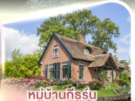
หมู่บ้านกีธูร์น