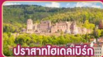
ปราสาทไฮเดิลเบิร์ก