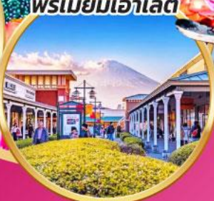
โกเทมบะ-พรีเมียมเฮ้าส์