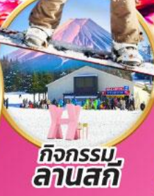
กิจกรรมลานสกี