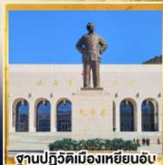
ฐานปฏิวัติเมืองเหยียนอัน