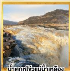
น้ำตกหูโง่วแม่น้ำเหลือง