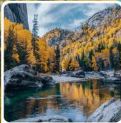
เคอเคอทัวไห่