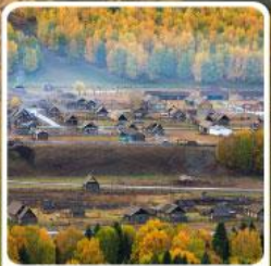
หมู่บ้านเหมอู่

สวรรค์ใบไม้เปลี่ยนสี เขื่อนคานาสีอแดนฟัน มหัศจรรย์หมู่บ้านเหมอู่ เคอเคอทัวไห่อัศจรรย์ภูผาหิน