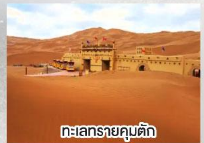
ทะเลทรายคุมตัก