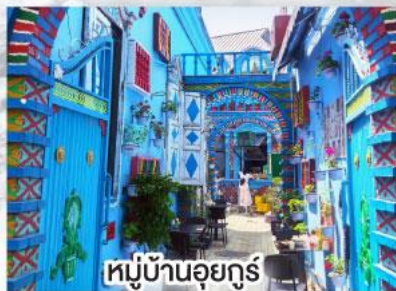
หมู่บ้านอุยгур์