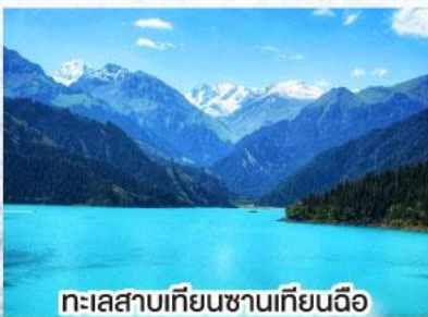
ทะเลสาบเทียนชานเทียนฉือ