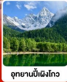
อุทยานπίงเิงโกว