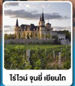
ไรไวน์ จูนยี่ เยียนไก