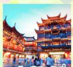
ตลาดร้อยปีเจิ้งหวงเมี่ยว