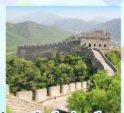
กำแพงเมืองจีน ด้านจวิยงกวน