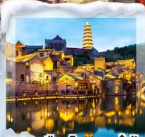
เมืองโบราณกุ๋เป่ย์