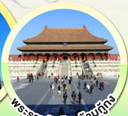
พระราชวังต้องห้ามทุกอง