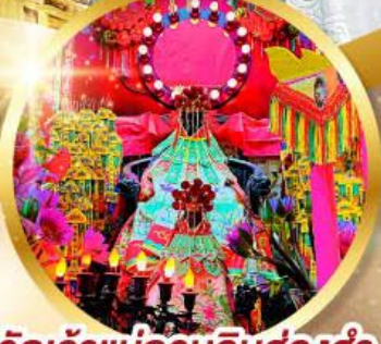
วัดเจ้าแม่กวนอิมฮ่องอ๋า

ขอเทพเจ้ากวนอู ความซื่อสัตย์ เงินทอง รุ่งเรืองมั่นคง