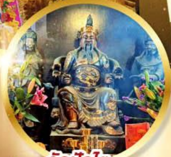
วัดบิกโต

เสริมโชคลาภนำความรุ่งเรือง ทุกด้านของชีวิต